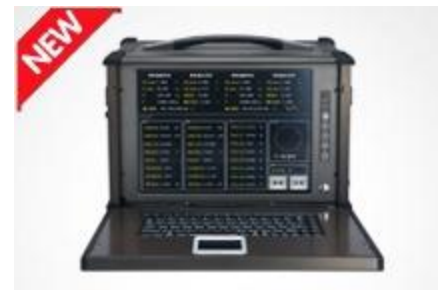
正余弦旋转变压器综合测试仪