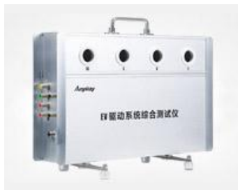
EV3000 动力系统综合测试仪